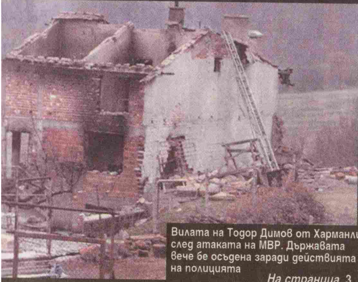
Вилата на Тодор Димов от Харманли след атаката на МВР. Държавата вече бе осъдена заради действията на полицията