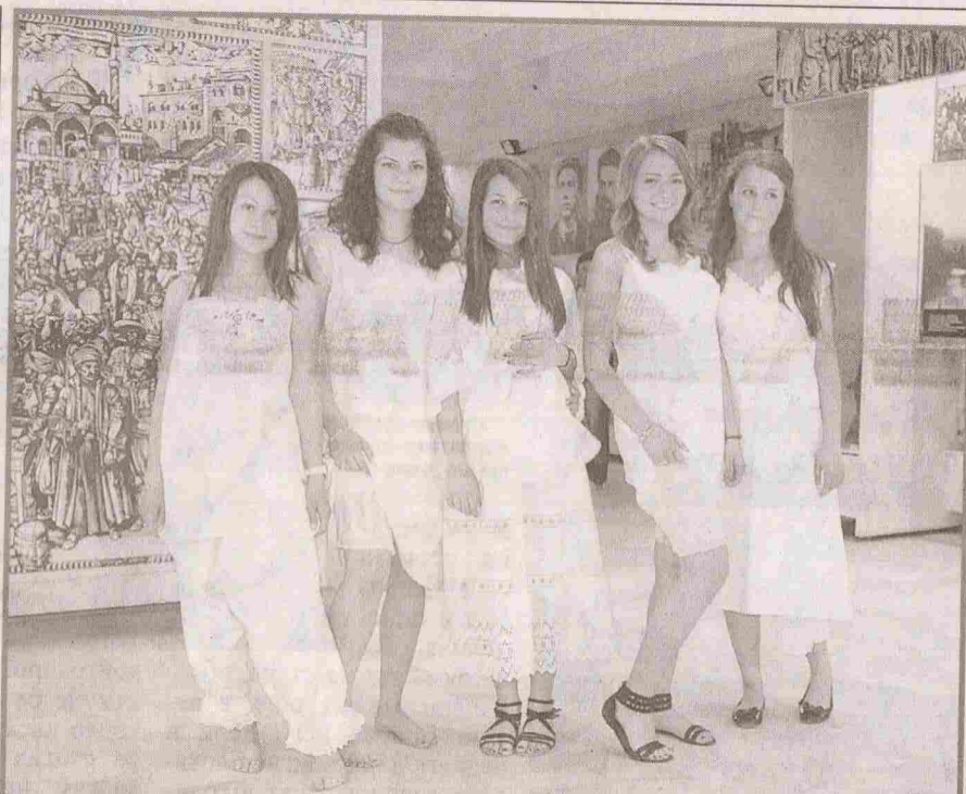
Манекени показаха градско бельо от края на XIX в. до 50-те години на XX в., по време на Европейската нощ на Музеите в Хасково. В Историческия музей нощта бе открита с изложба "Девет товара коприна и още девет везани"

Фирми от секторите на строителството, тър- говията, туризма, тран- спорта, са най-често в сивия сектор.◀